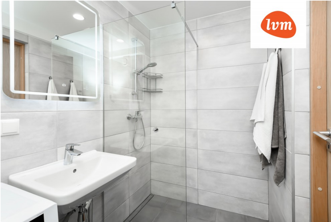
KANALI 8F KORTER 6, 38,1+10 m 2