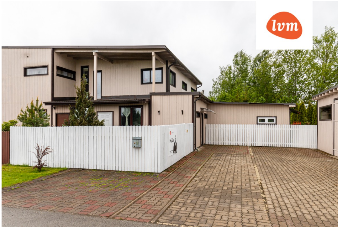
section of house, Katkuniidu tee