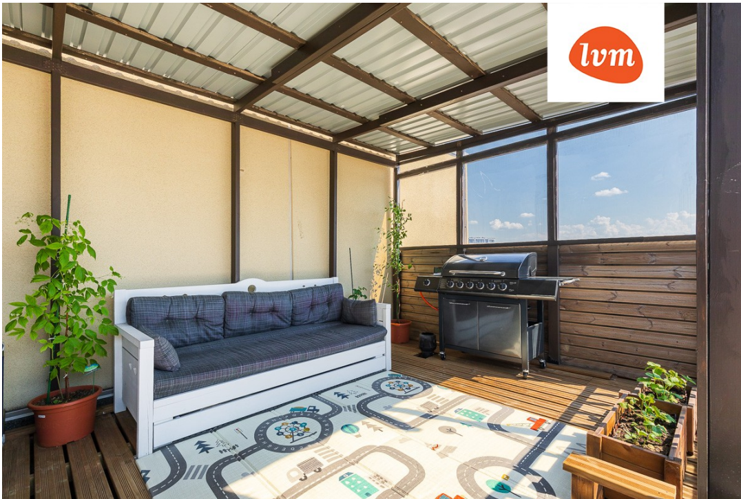
apartment, Aiandi 6/1