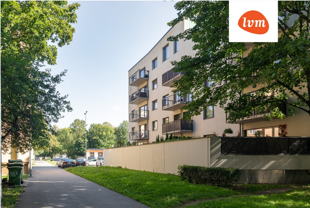
Tuulemaa tee 4