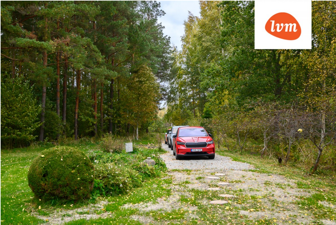
Männituka, Tahkuranna I korrus