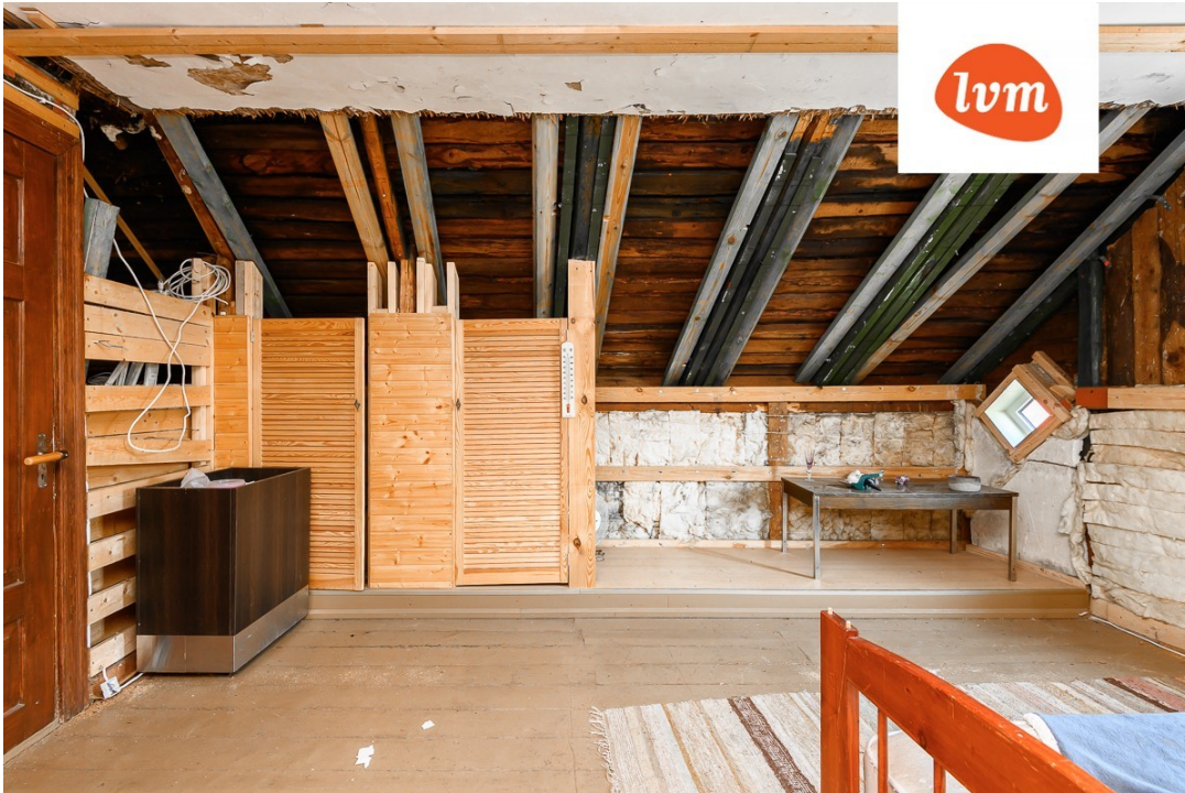
Rähni 6 I korrus