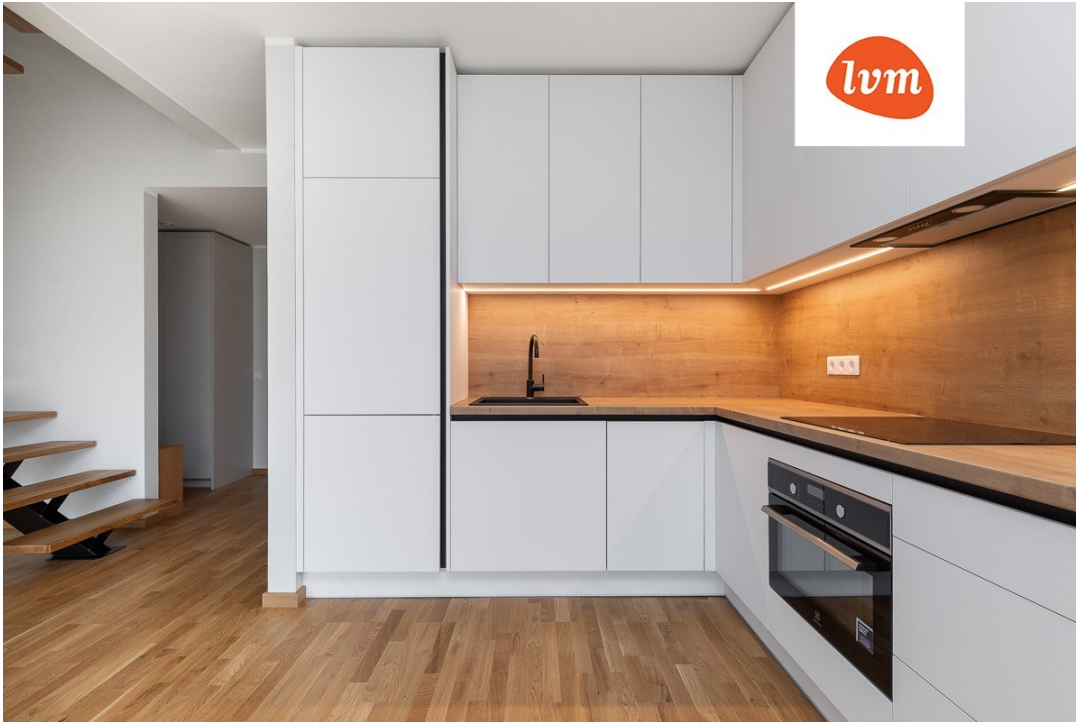
Käänu 28-8 I korrus