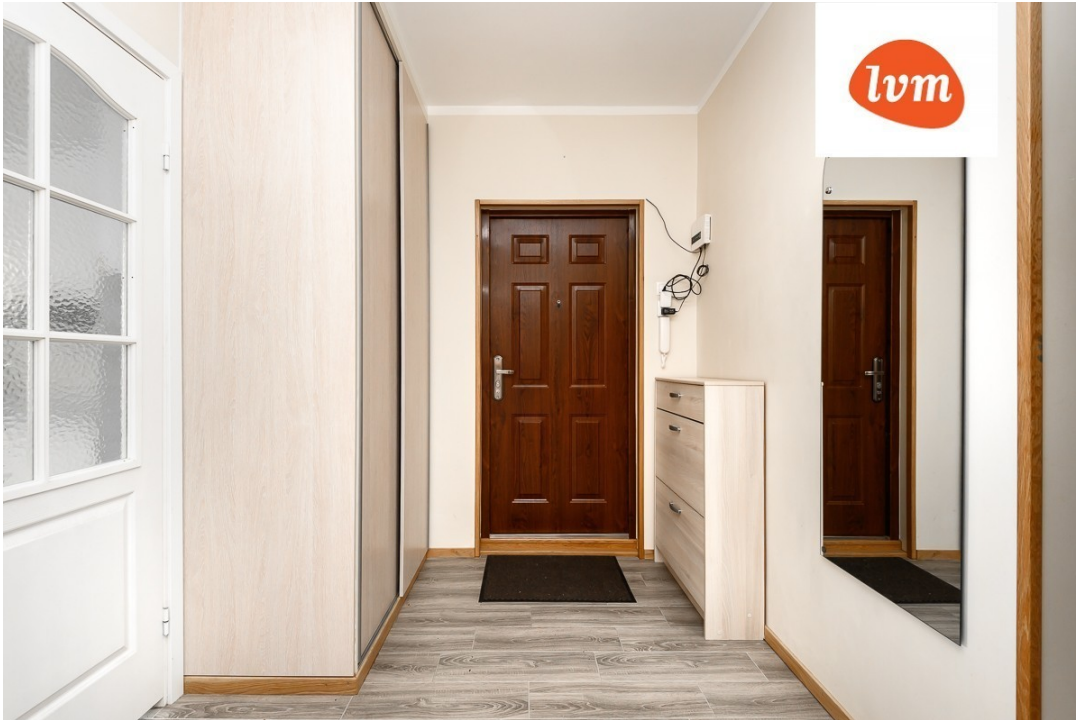
Mai 8 Pärnu