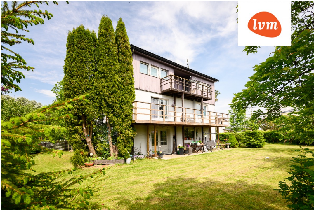
Purje 2 Pärnu I korrus