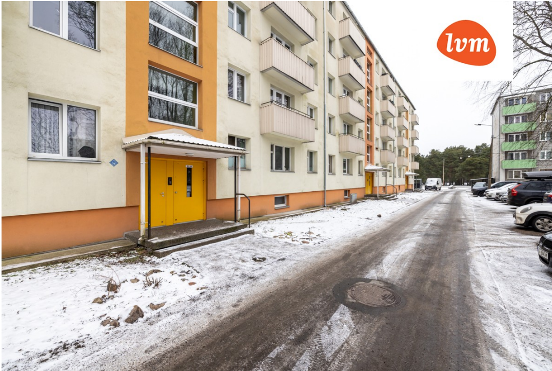
E. Vilde tee 117