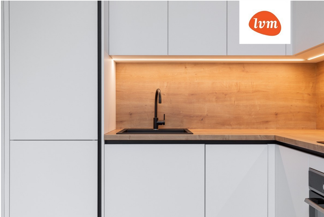
Pihlaka 24-8 I korrus