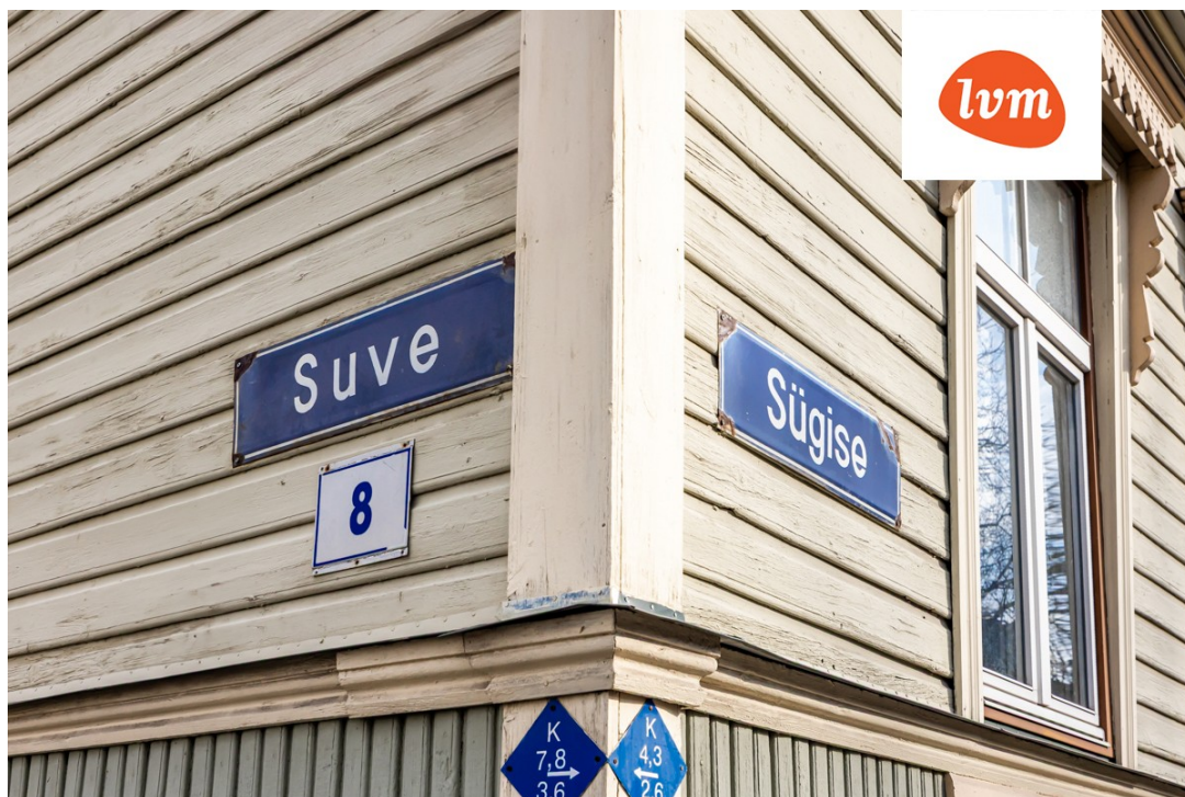
Sügise 14 I korrus