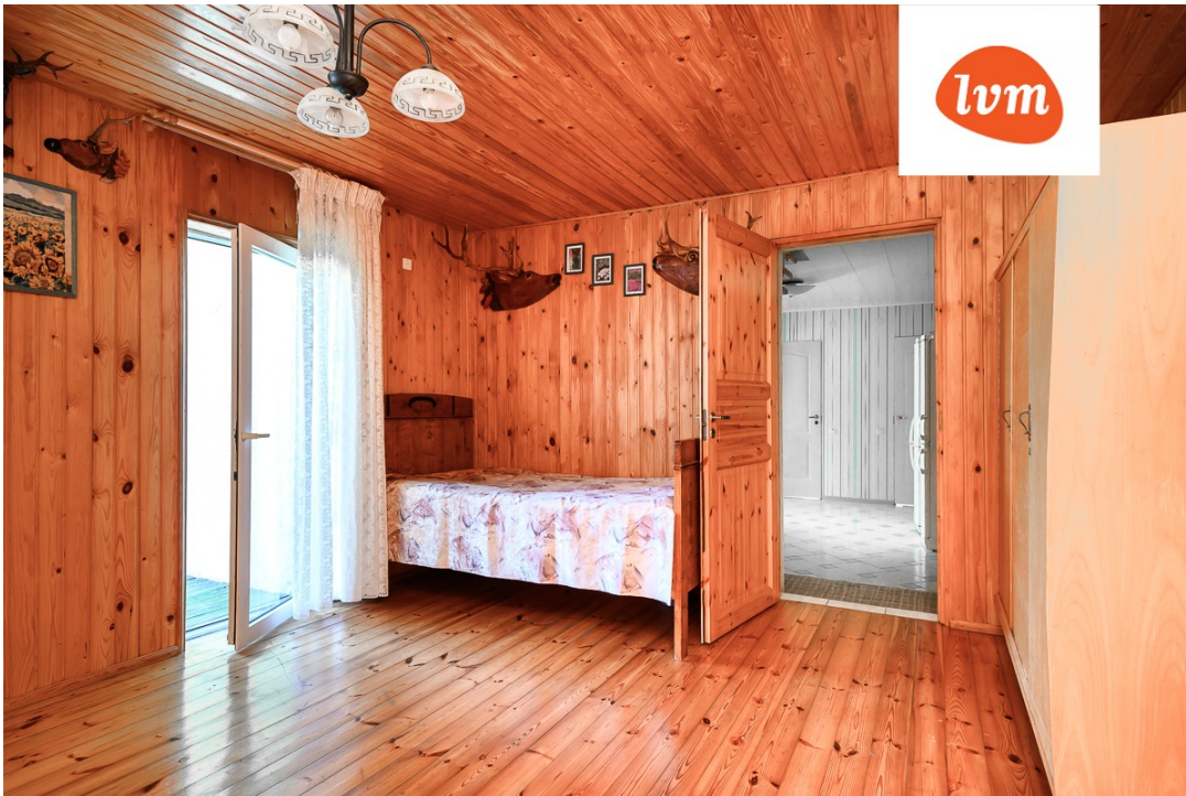
Karusselli 70 I korrus