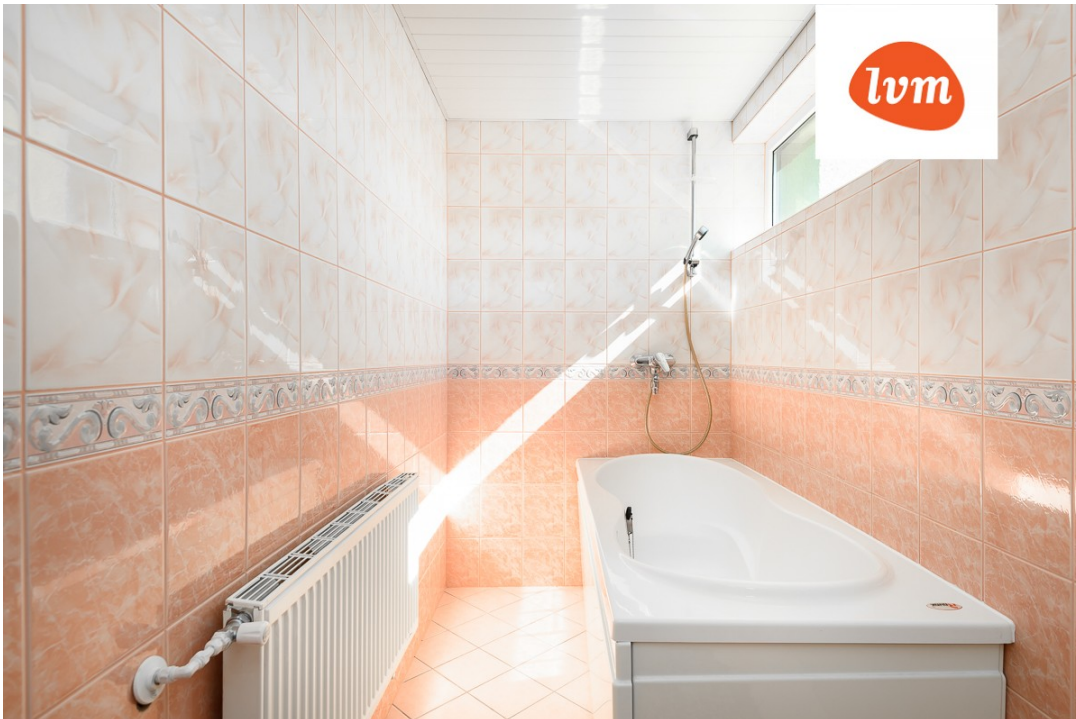
Karusselli 70 II korrus