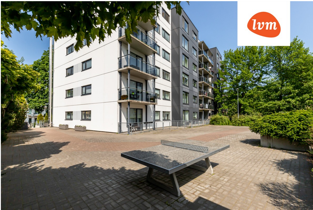
Pärnu mnt 129c/1