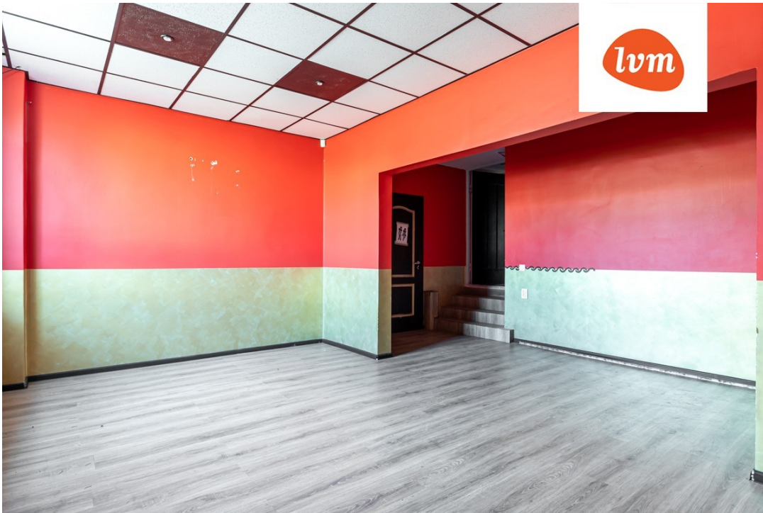
Stardi 2 I korrus