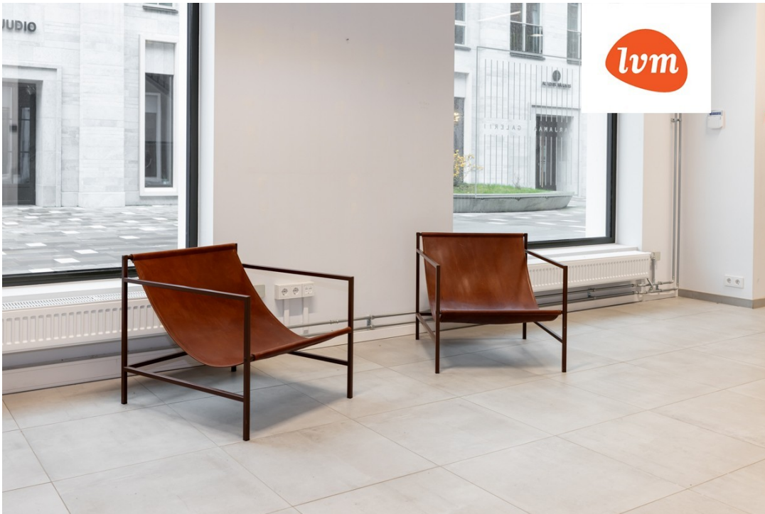
StAAPli 3 Põhikorrus