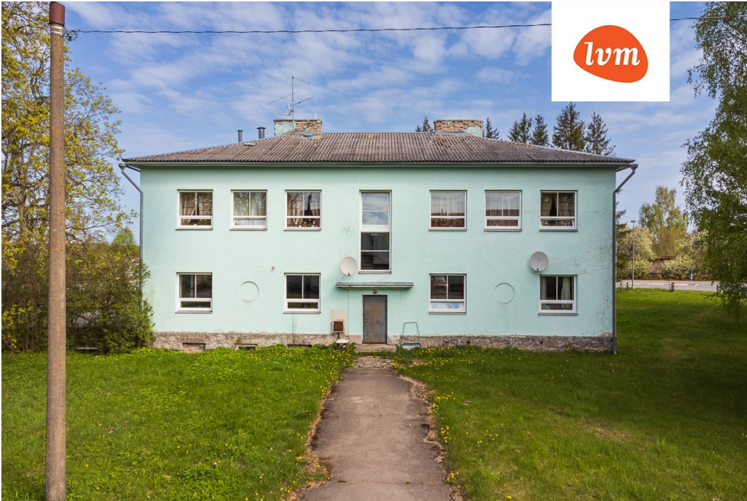
Ardu külalistemaja I korrus