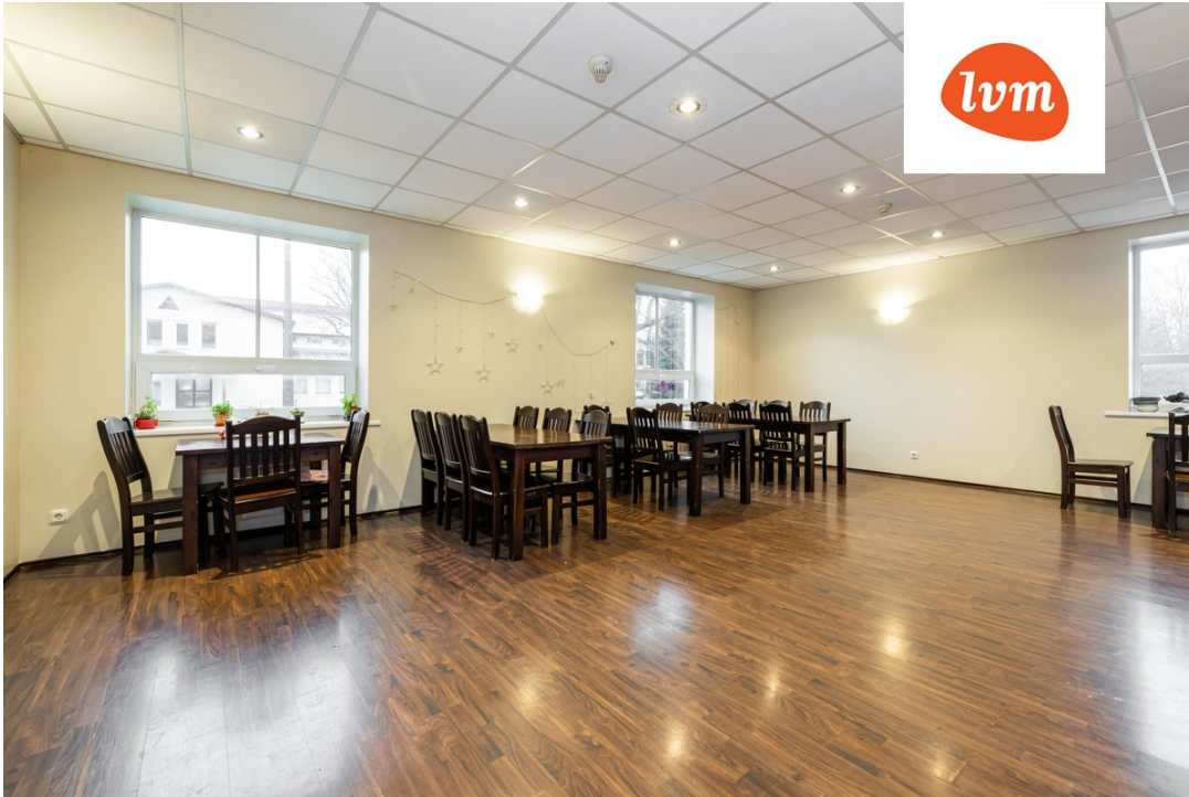
Ardu külalistemaja II korrus