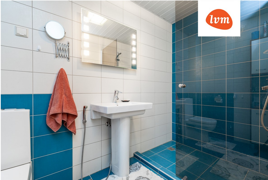
Kitse 2, Uuesalu I korrus