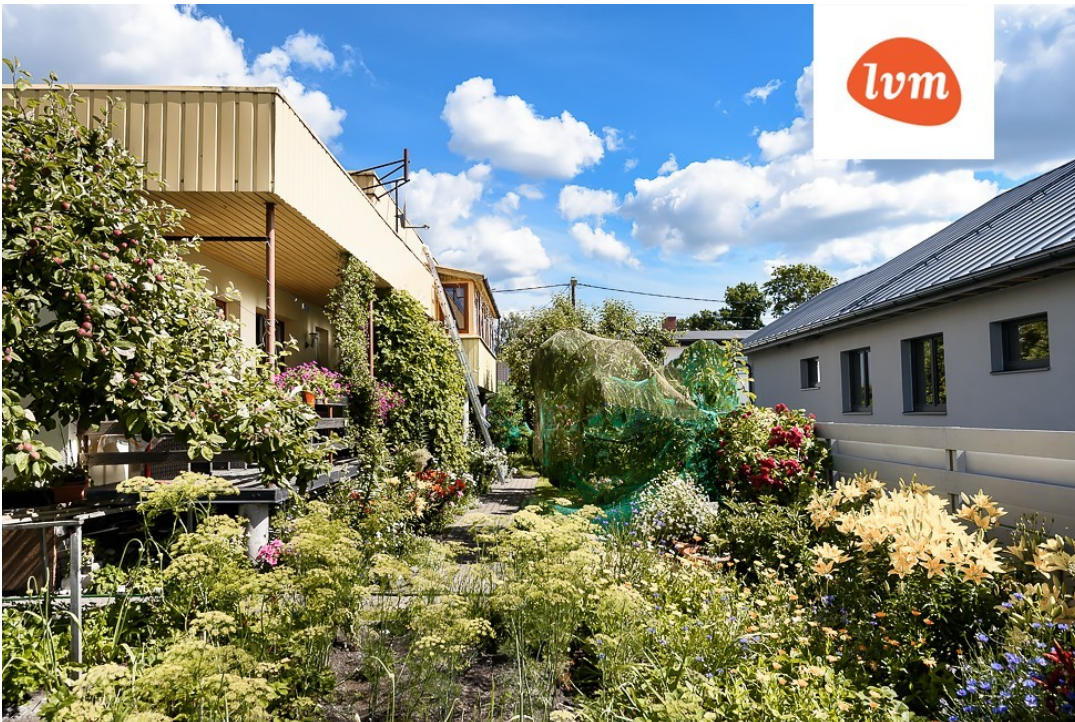
Püssi 12 I korrus