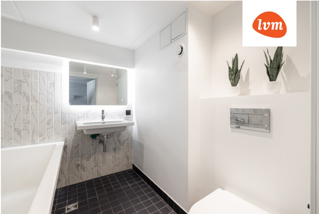
Tööstuse 47D II korrus