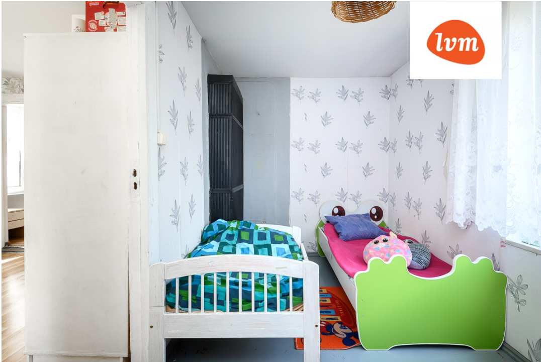
Roosi 12 Pärnu I korrus