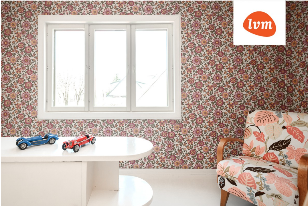
Karja 62a, Pärnu I korrus