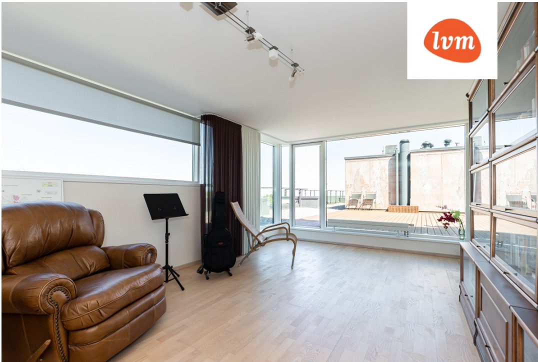
Selise tn 26 II korrus