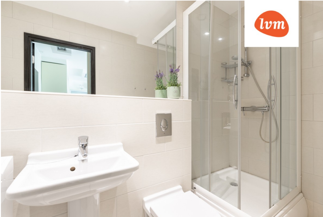
Selise tn 26 I korrus