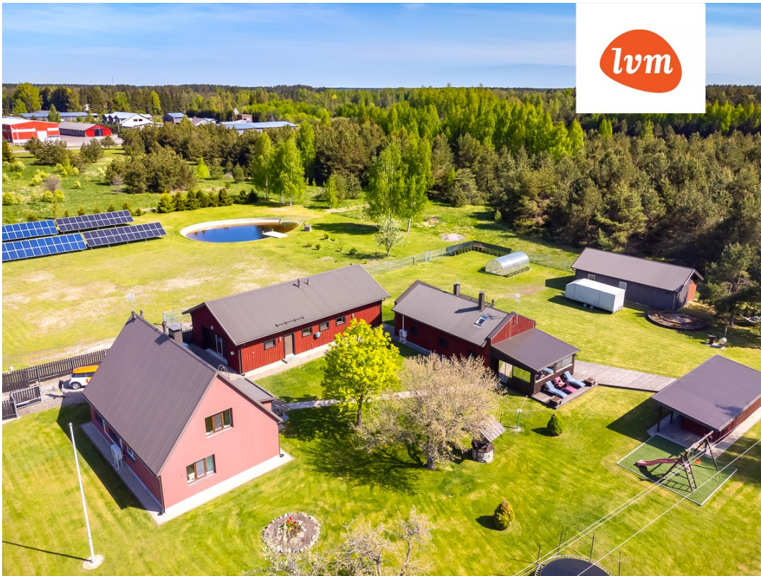
Soometsa tee 31 elamu I korrus