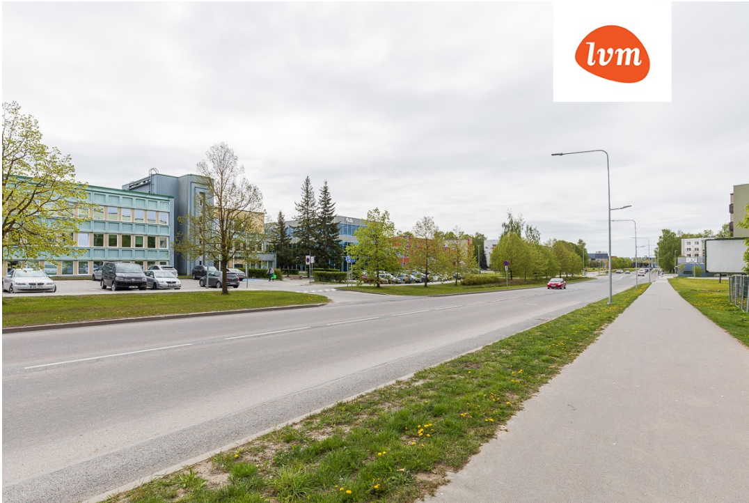
Sõpruse pst 1