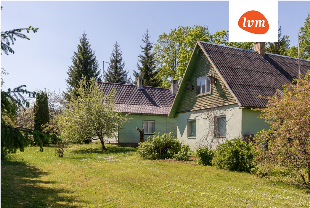
Luha 1 Rápina Elumaja