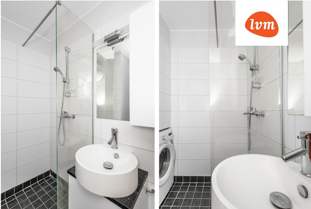
Suur-Kuke 15a 1 tuba, 26.2 m 2