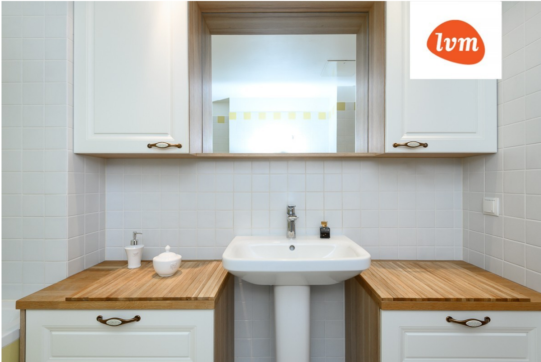
Papli 27 3 tuba, 57.5m 2