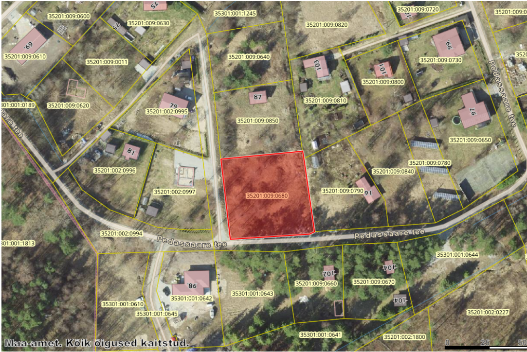
Maa-amet. Koik õigused kaitstud.