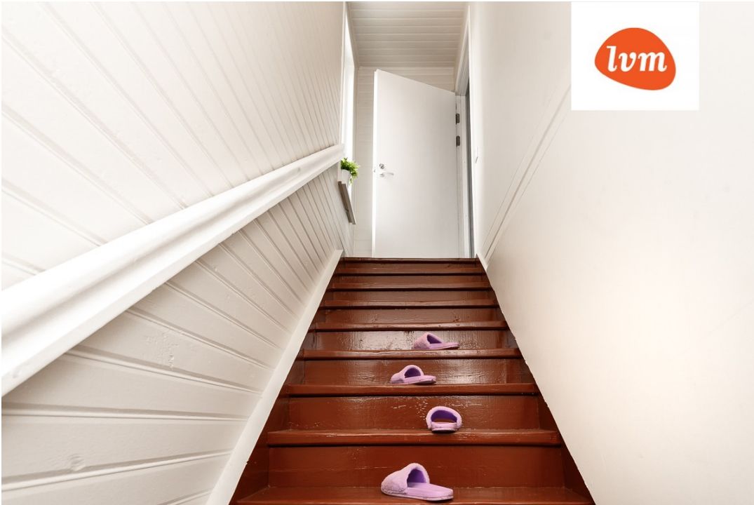
Suur- Kuke 48 4 tuba, 99m 2