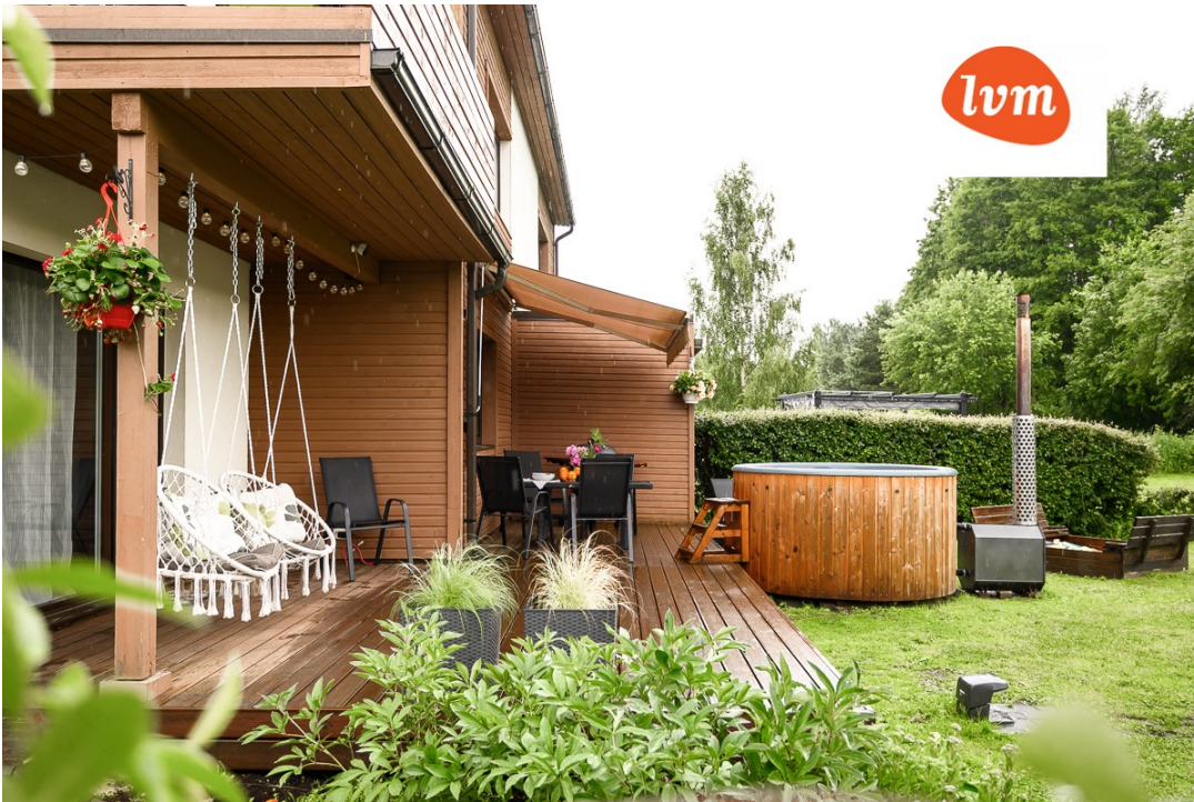
Pihla tee 15, Tahkuranna I korrus