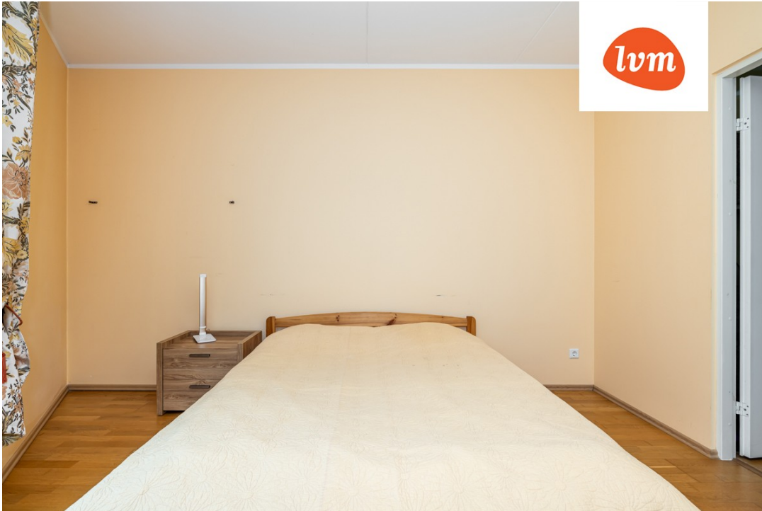
Tähe 105b soklikorrus