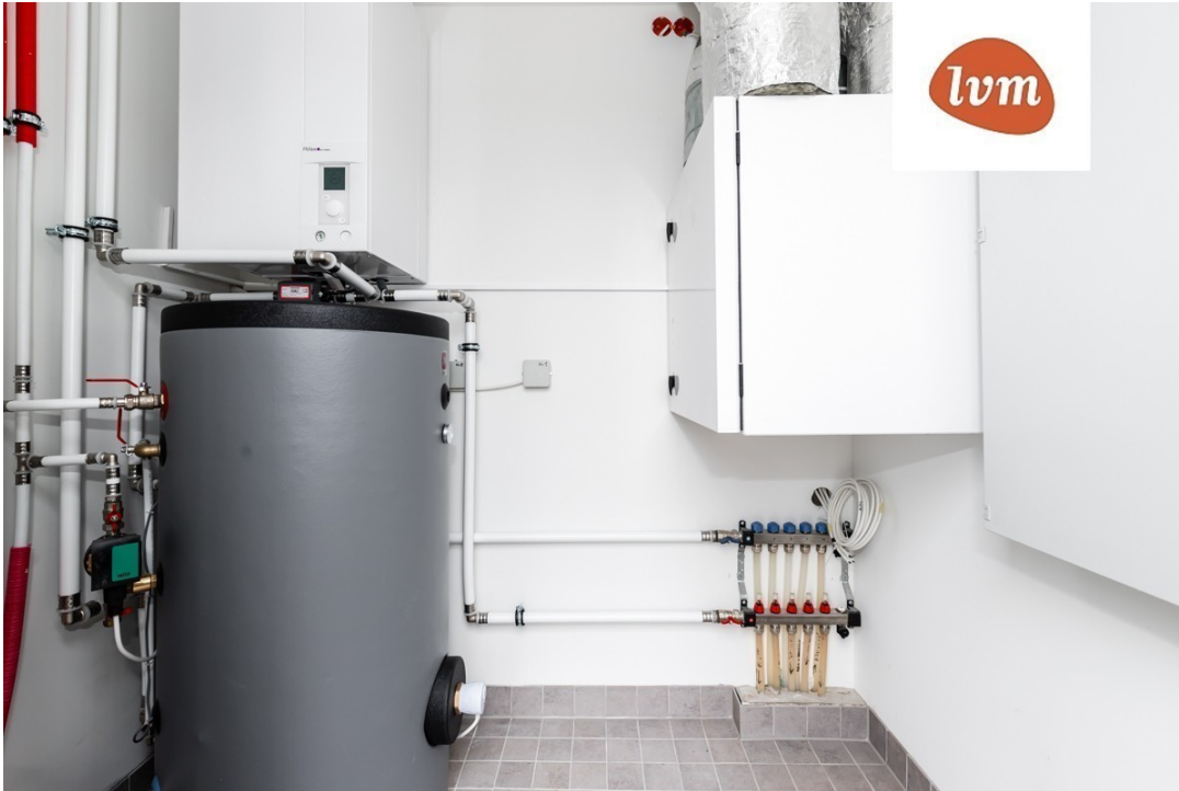
Abara 14 I korrus