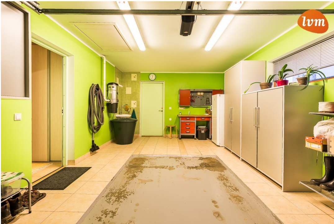
Suur-Kuke 64B I korrus