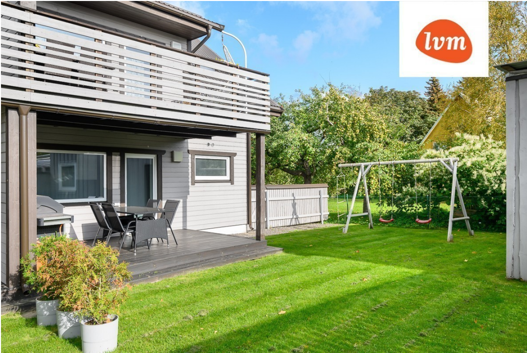
Maarja 16 II korrus