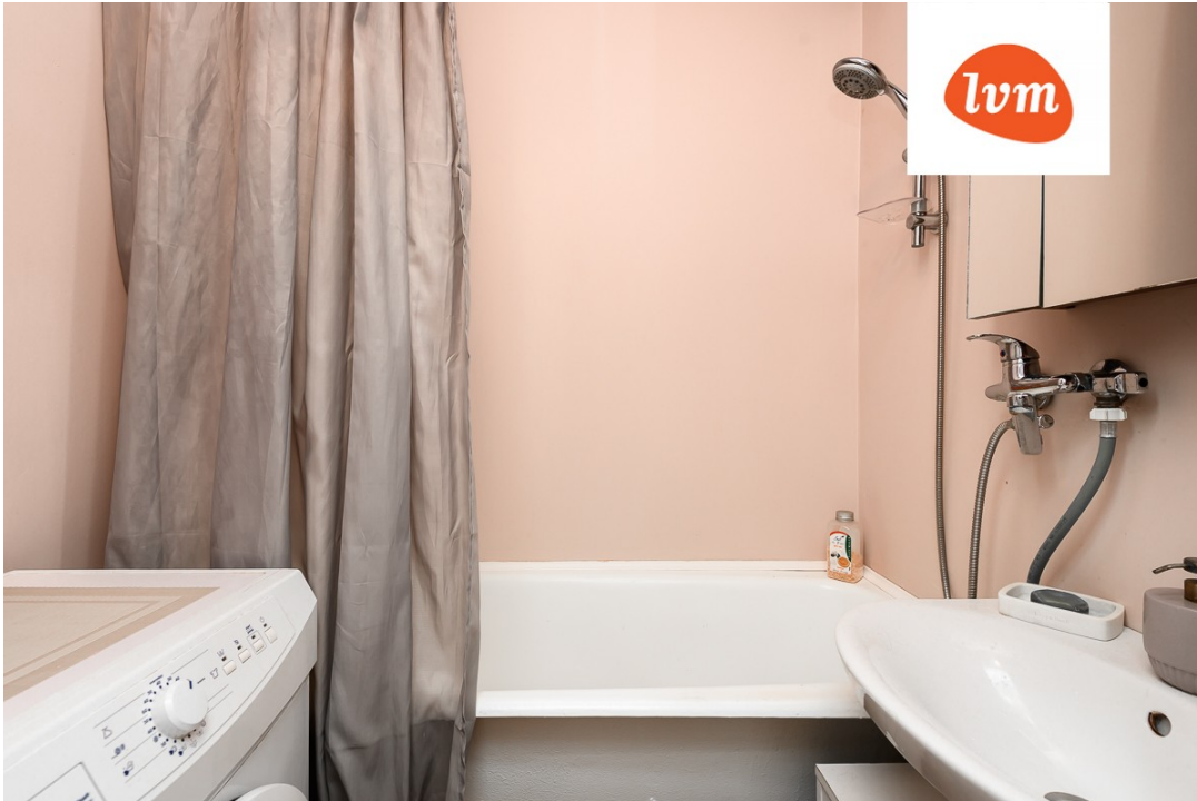
Möisa vkt 5 Uulu