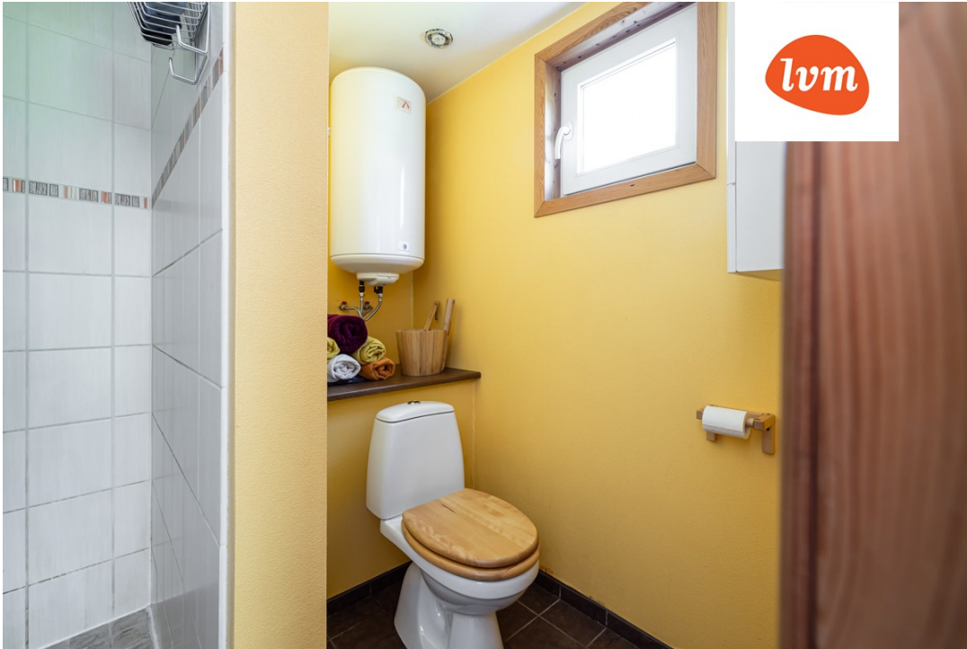
Peetri tee 14 I korrus