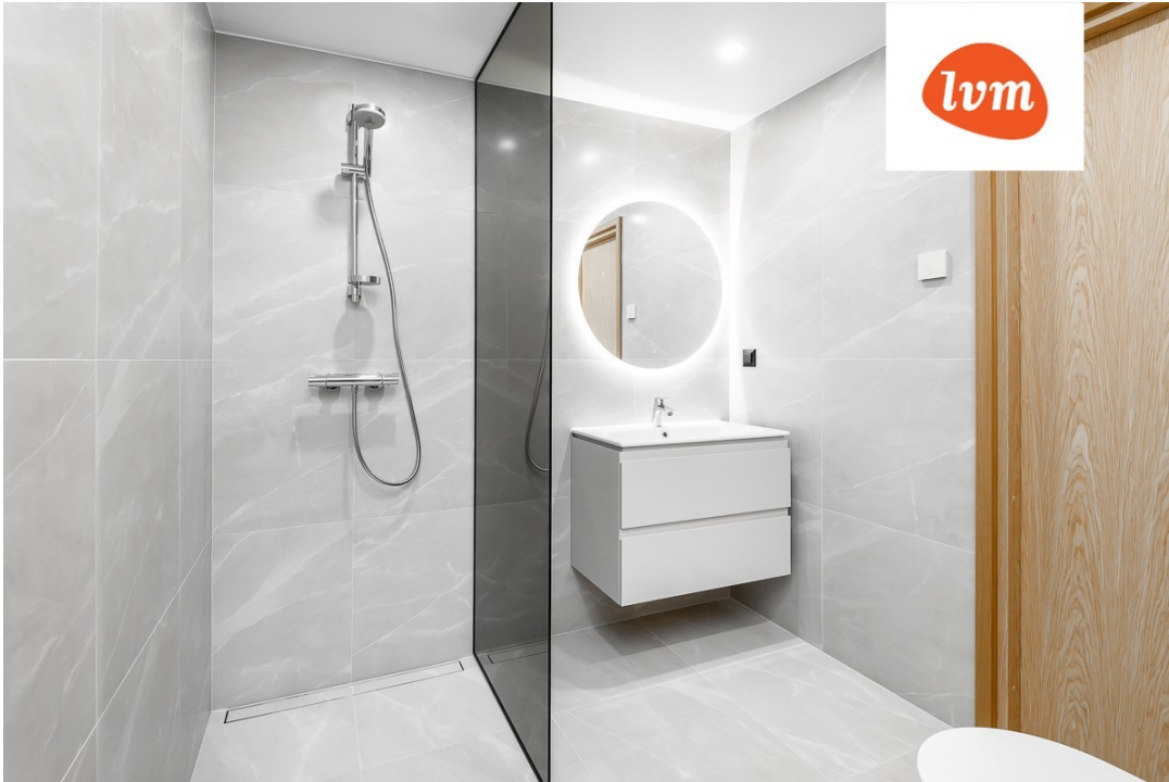
Hirvela 13 Korter 14, 3 tuba, 63,6 m 2