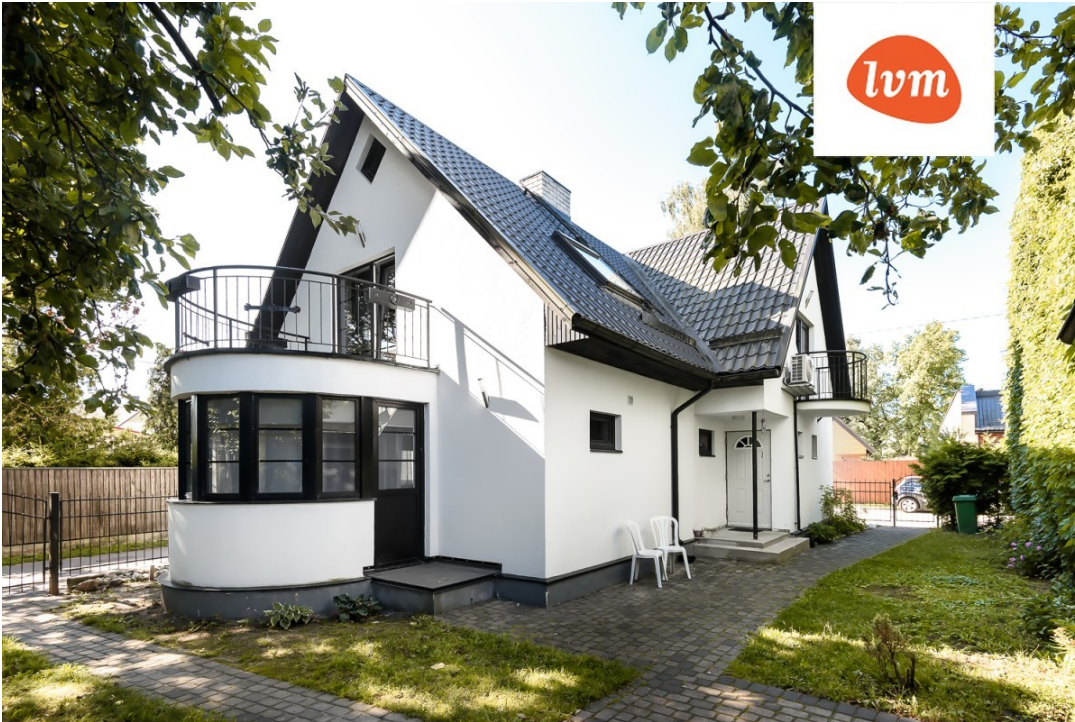
Väike-Veski 14 I korrus