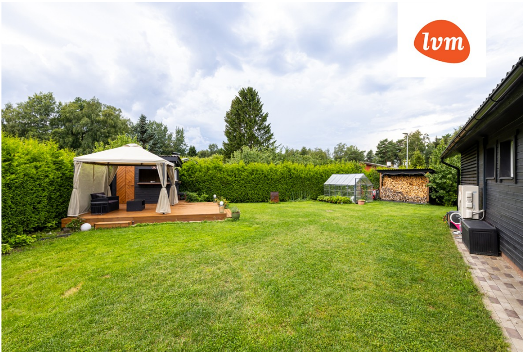
Kasteheina 3 I korrus