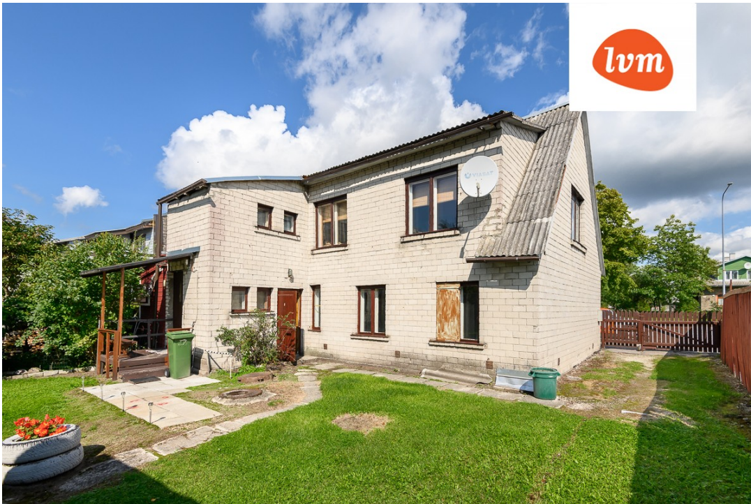
Riia mnt 157