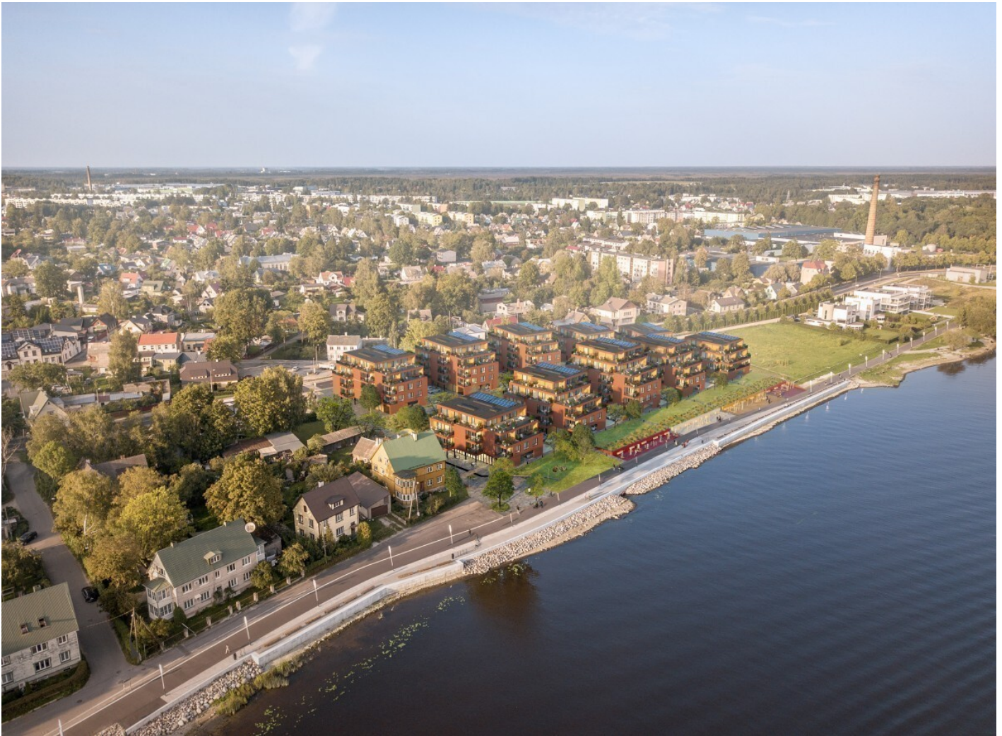
Korter, Rääma tn 7C/1-9