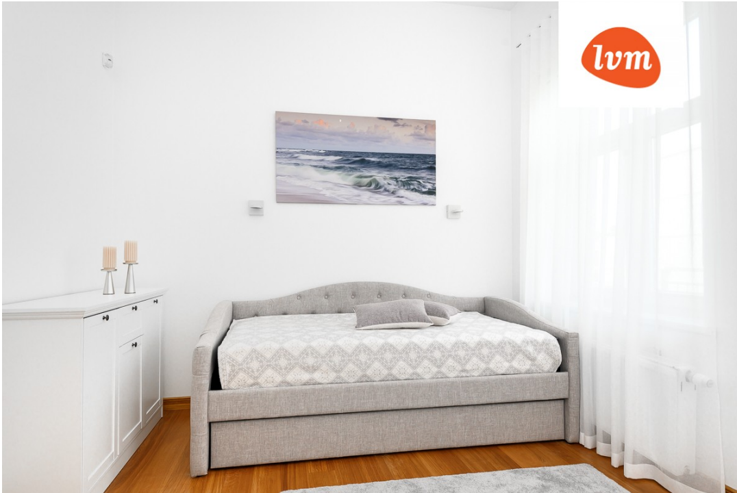
Lehe 1/2 Pärnu