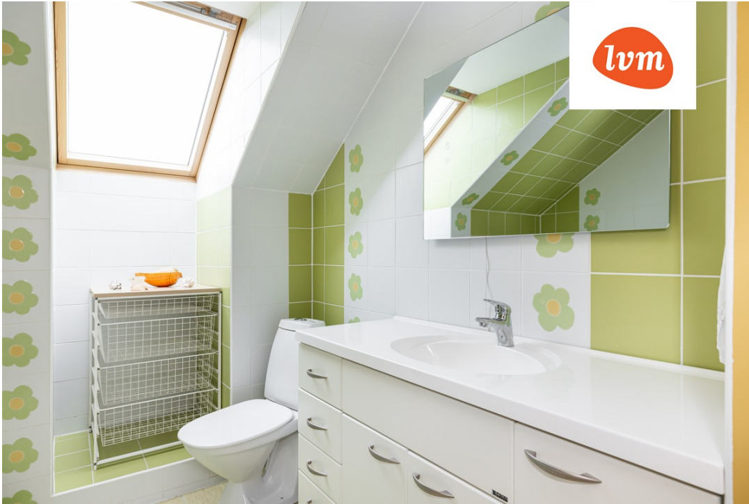
Allika 31 II korrus