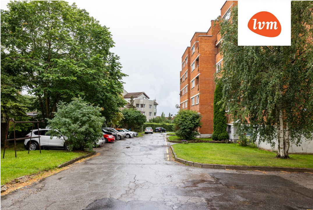
Aiandi tee 14