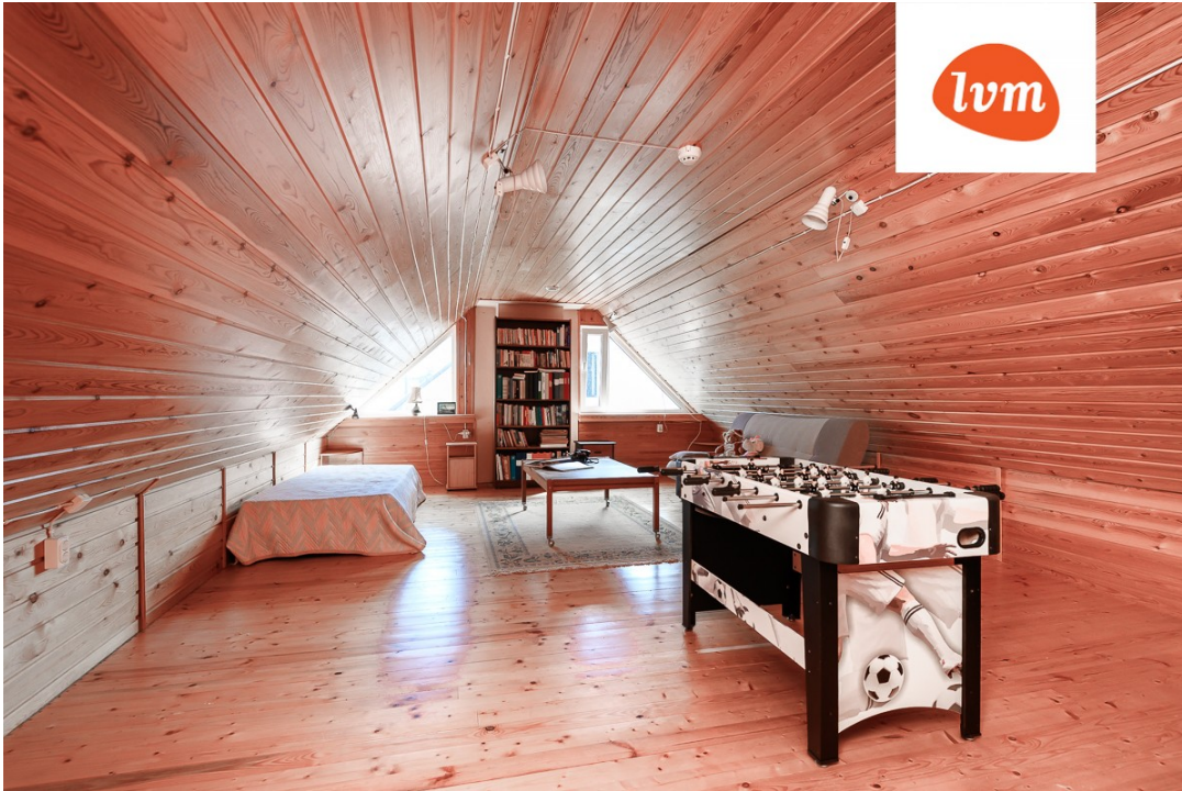
Tareia tee 2 katusekorrus