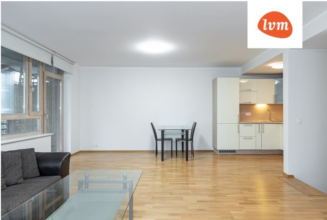
Komeedi 14 I ja II korrus