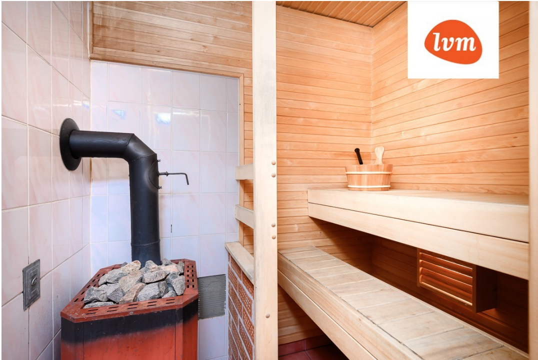
Papsaare tee 6 I korrus