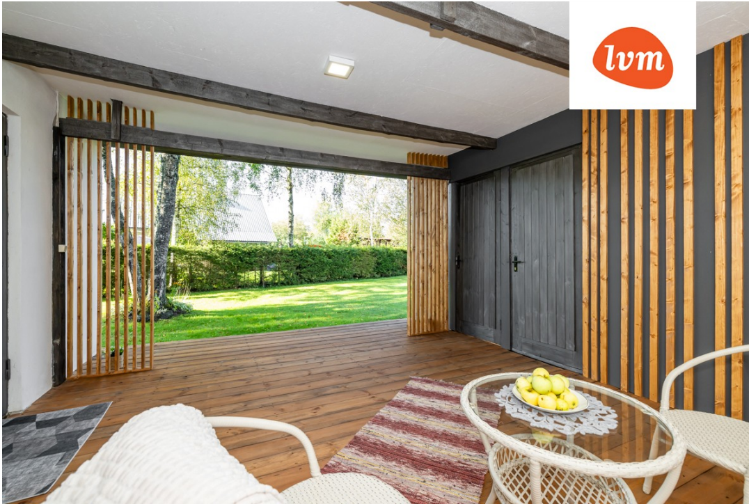
Kapa vkt 58 Aespa I korrus