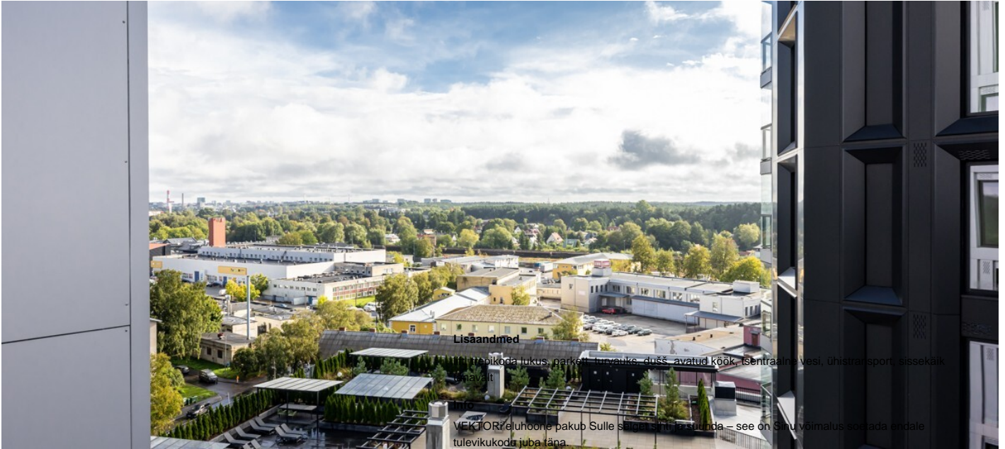
Korter, Pärnu mnt 137