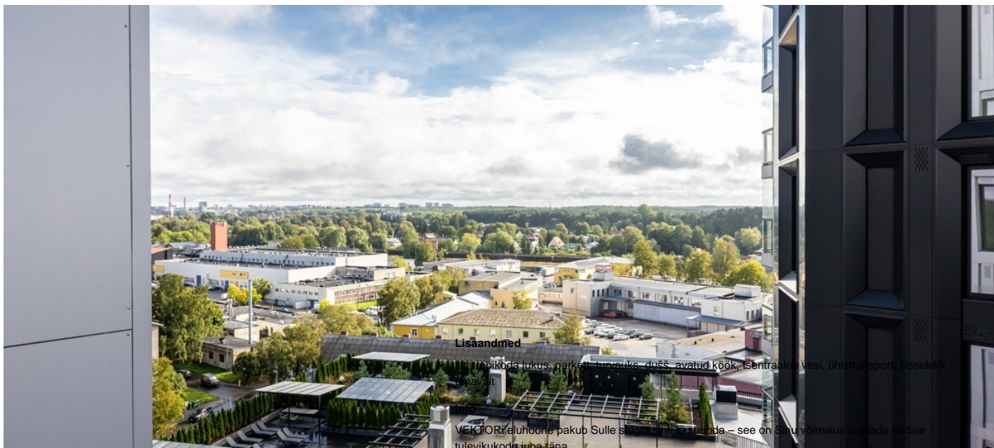
Korter, Pärnu mnt 137