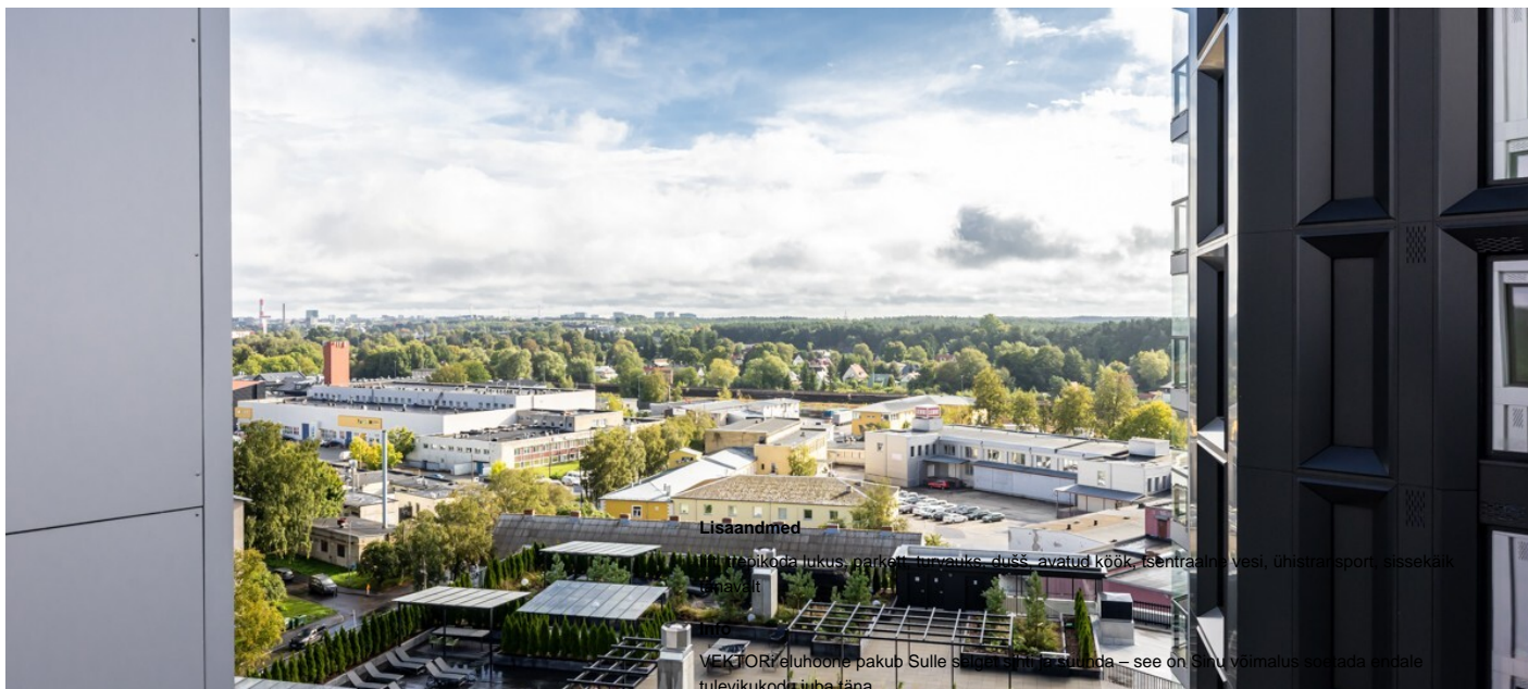
Korter, Pärnu mnt 137